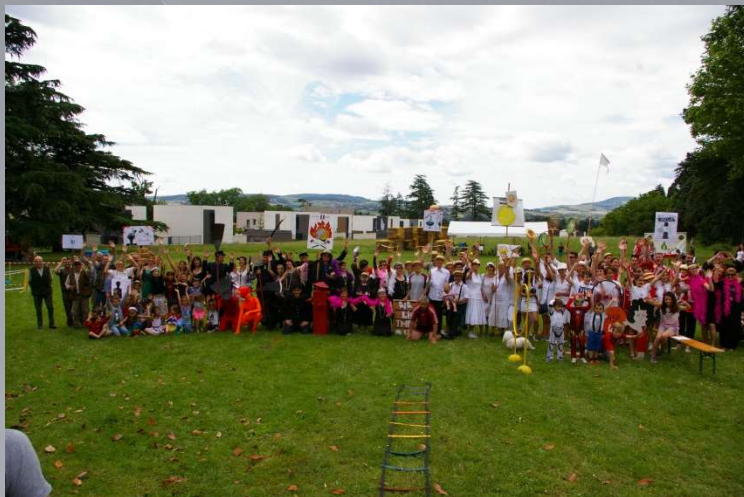
Fête de village dans le Parc à l'occasion des 30 ans de la fête des associations

Foire agricole de Pâques, toujours un succès et un beau travail des associations investies, bénévoles et municipalité