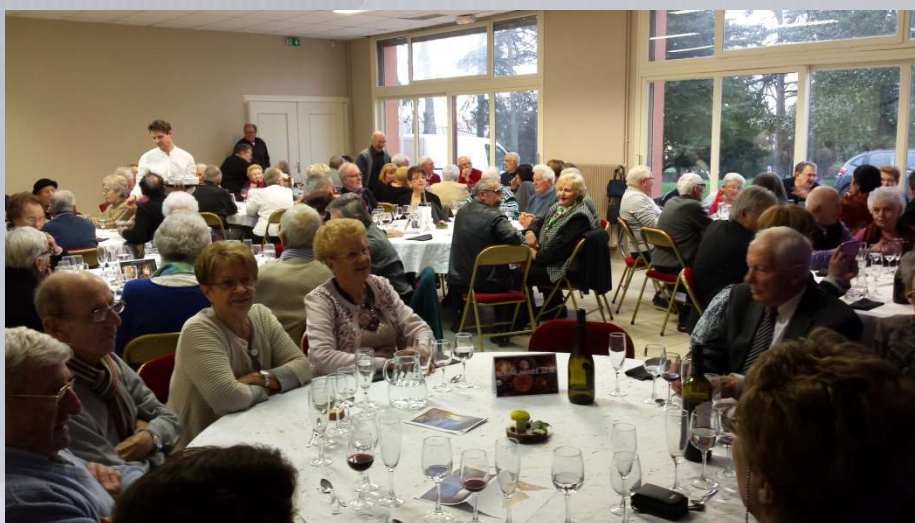
Repas des ainés de la commune