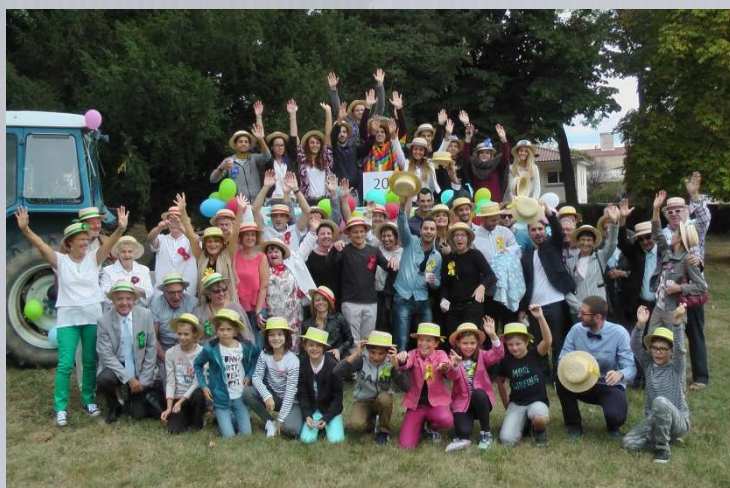
YACA: fête des classes