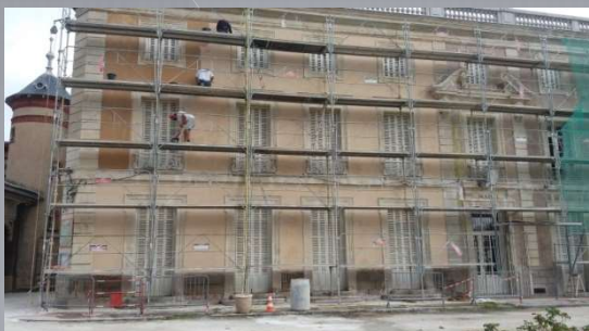
Rénovation de la façade de la Mairie