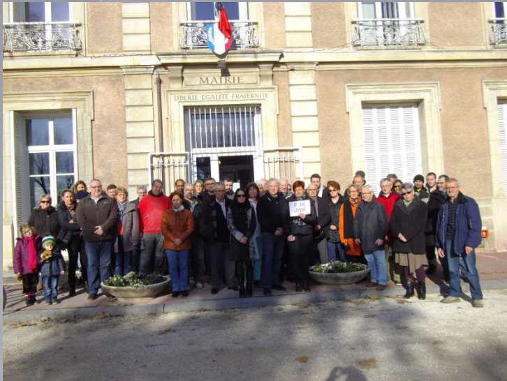
Rassemblement en hommage aux victimes de l'attentat contre Charlie Hebdo