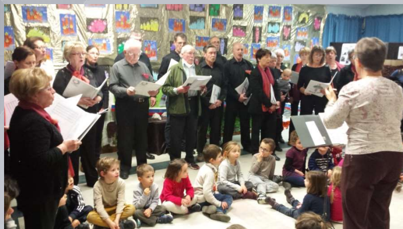
La chorale chant d'Eole offre des chants à l'école maternelle lors du vernissage de son exposition sur la Russie