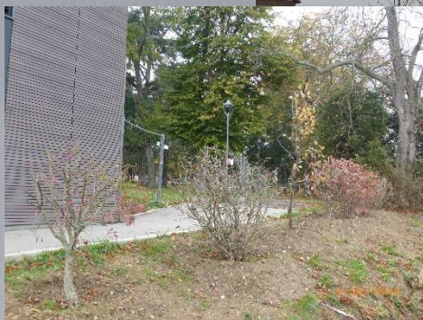
Plantation d'arbres et de haies