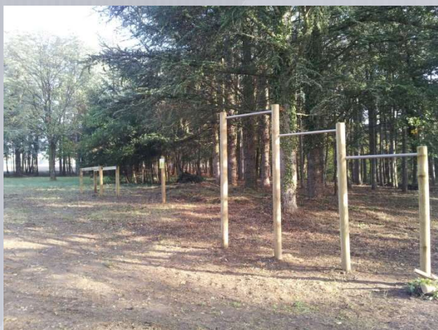
Création d'un parcours sportif