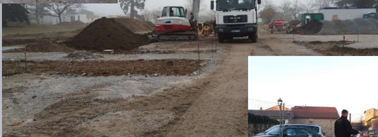
Travaux dans le Parc